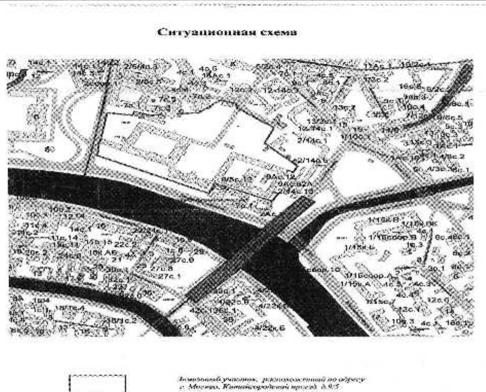
Схема расположения объекта недвижимого имущества на земельном(ых) участке(ах):